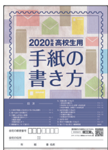
手紙の書き方テキスト